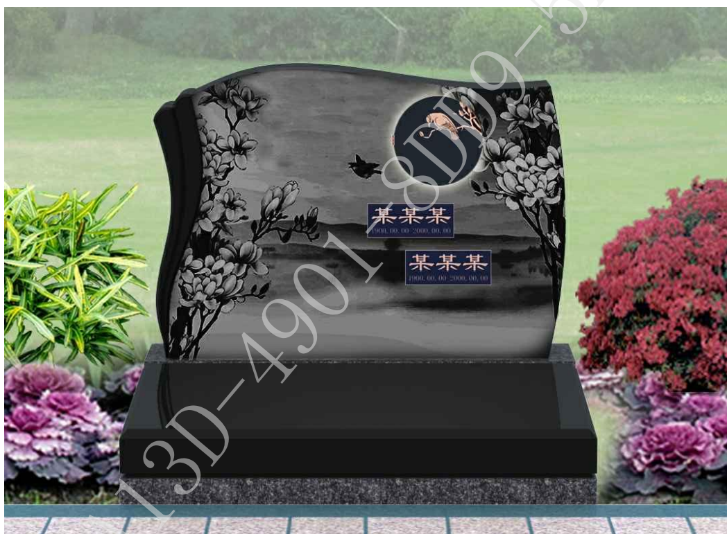
骨灰盒面对面墓型