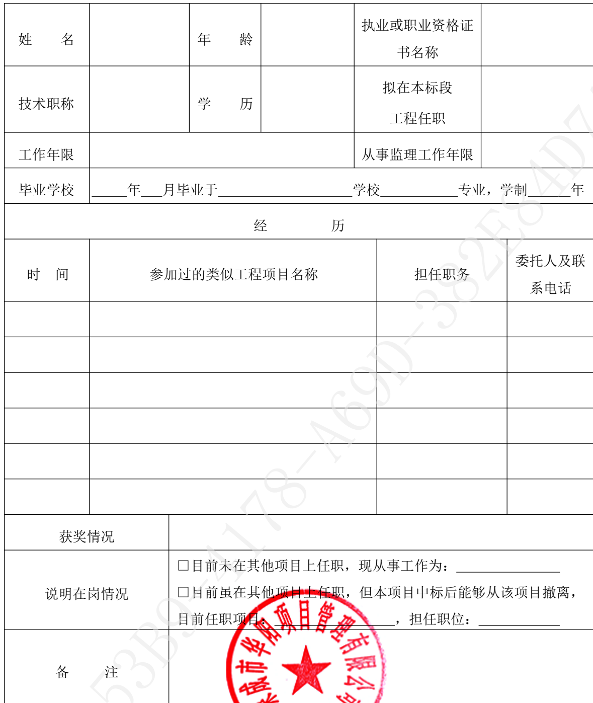
拟委任的总监理工程师资历表