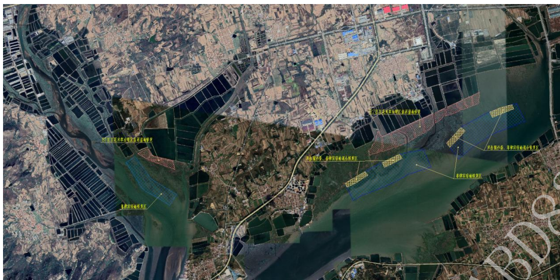
图 1.3-1 本标段平面位置图