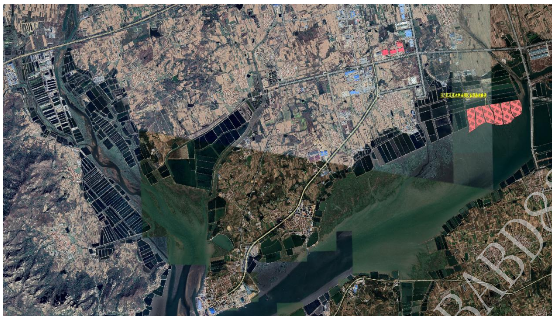
图 1.3-1 本标段平面位置图