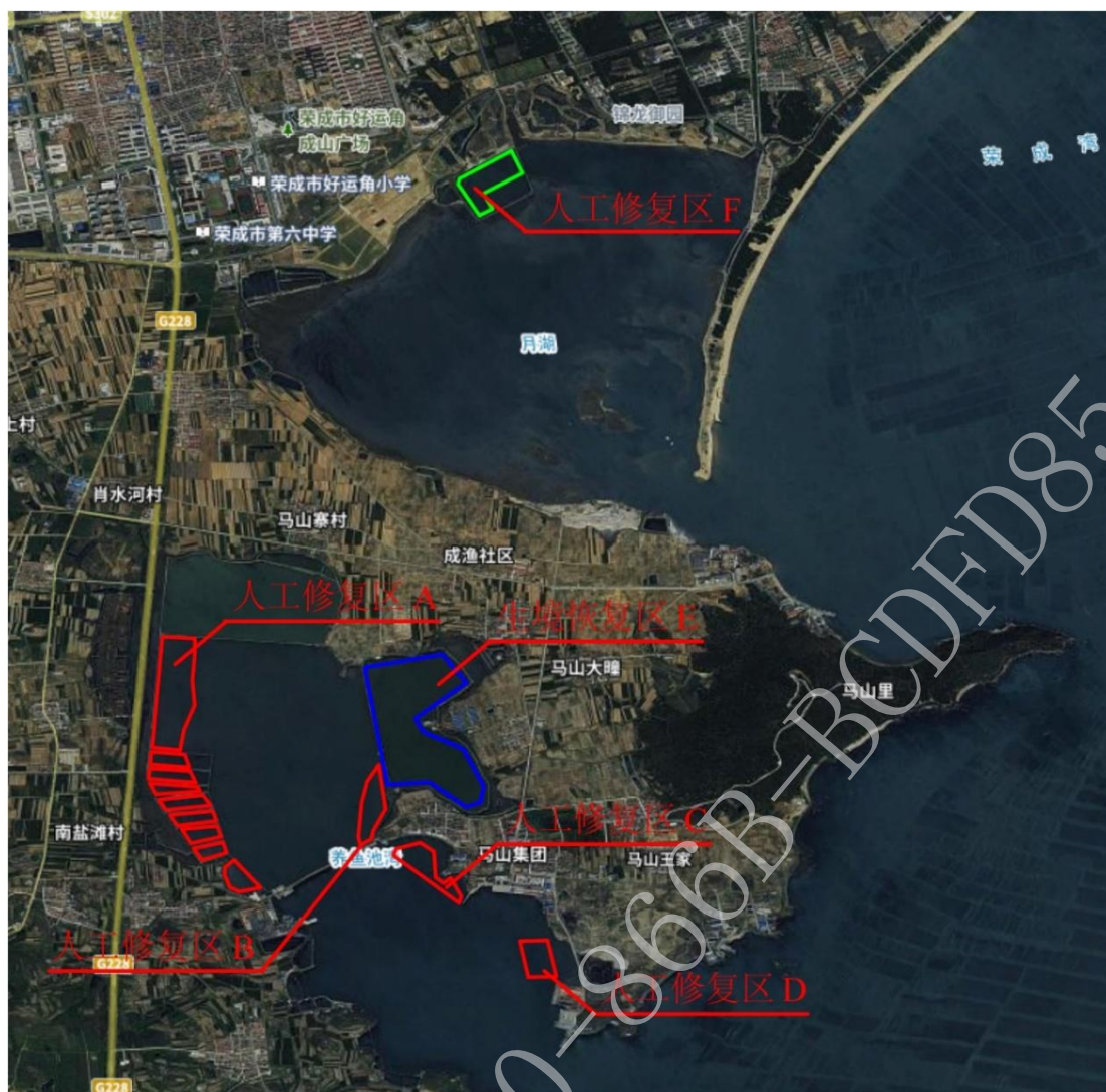
图 1 项目平面位置示意图