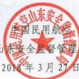
山东安全监督管理局