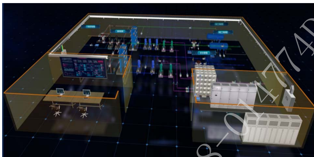
站内设备模型 3D 例图：