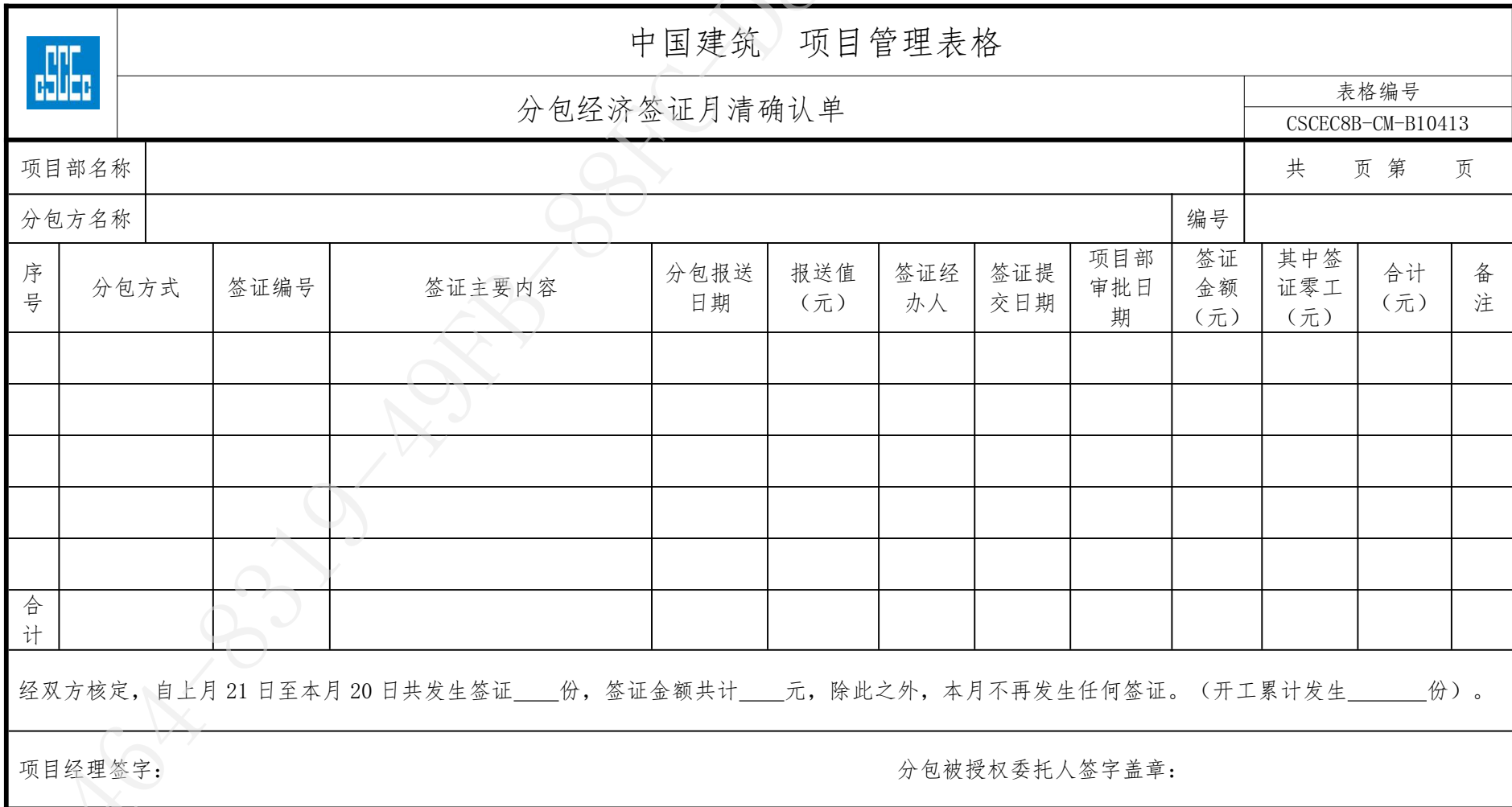
附件十三：《分包经济签证月清确认单》格式